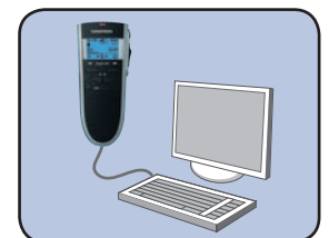
... USB-Audio zum Diktieren am PC