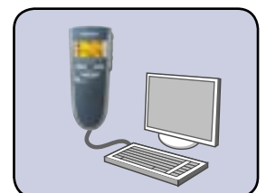
... USB-Audio zum Diktieren am PC