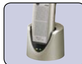
Kombinierbar mit Akkuladestation DigtaStation und ...